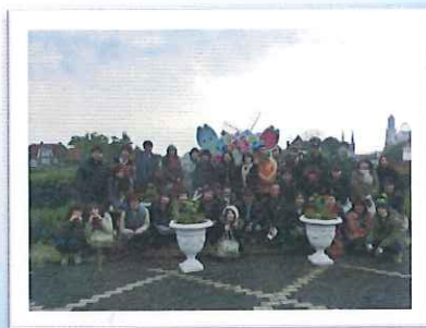
ハウステンボスで集合写真