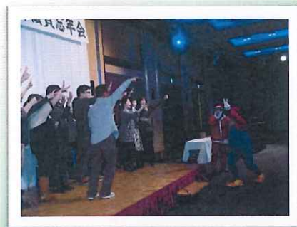
敗者復活戦でジャンケンポン