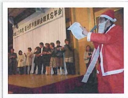
盛り上がったビンゴ大会