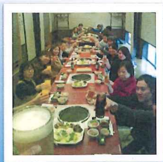
佐賀牛堪能しました

平成 25 年 11 月 佐賀の紅葉、ハウステンボス、人吉球磨川下りの 3 コースに分かれて、職員研修旅行に行ってきました。