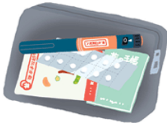
お薬やインスリンと注射器具 糖尿病手帳