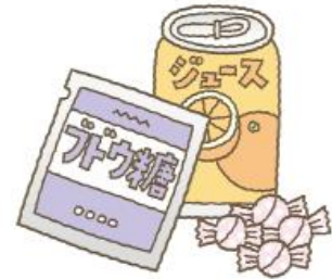
補食(飴玉、ビスケットなど) と フドウ糖や砂糖など