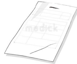
海外旅行時は現地語か英語 で書かれた診断書